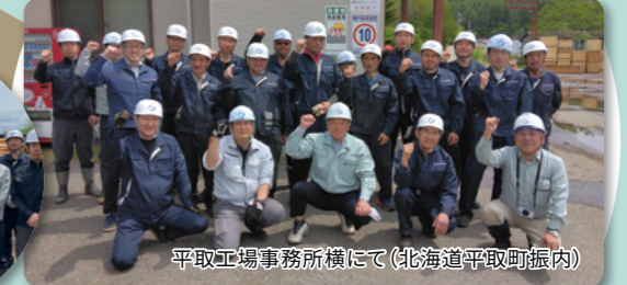
平取工場事務所横にて(北海道平取町振内)

森からのめぐみを受けて「確かな品質と安全操業」で未来へつなぐ製材会社として前進してまいります。