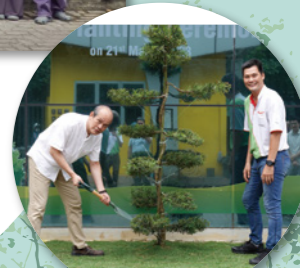
KK CEOとネルソン工場長

「私たちは高機能ラベル製品で未来を先取りします!」 高機能ラベル製品は豊かな創造性と高い技術力の融合をもって、作り上げられるものです。森林を健全に育てることと同じように、人材の育成と技術の伝承は未来のラベル事業を担う財産です。 王子グループ各社と連携し、世界中のお客様に寄り添った提案、喜んで頂ける製品をお届けできるよう、絶え間ない努力と「One for All, All for one」のチーム力で、時代を突き動かす新しいブランドを構築します。