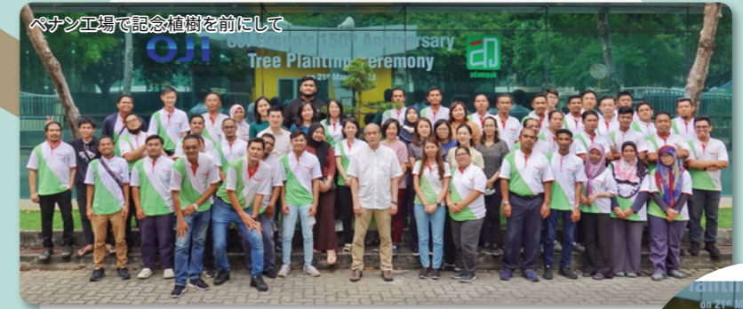
ベナン工場で記念植樹を前にして

「私たちは高機能ラベル製品で未来を先取りします!」 高機能ラベル製品は豊かな創造性と高い技術力の融合をもって、作り上げられるものです。森林を健全に育てることと同じように、人材の育成と技術の伝承は未来のラベル事業を担う財産です。 王子グループ各社と連携し、世界中のお客様に寄り添った提案、喜んで頂ける製品をお届けできるよう、絶え間ない努力と「One for All, All for one」のチーム力で、時代を突き動かす新しいブランドを構築します。