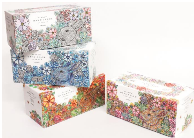
塗り絵を施した「nepia 大人の鼻セレブ」(イメージ)