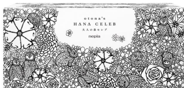
「nepia 大人の鼻セレブ」新パッケージ裏