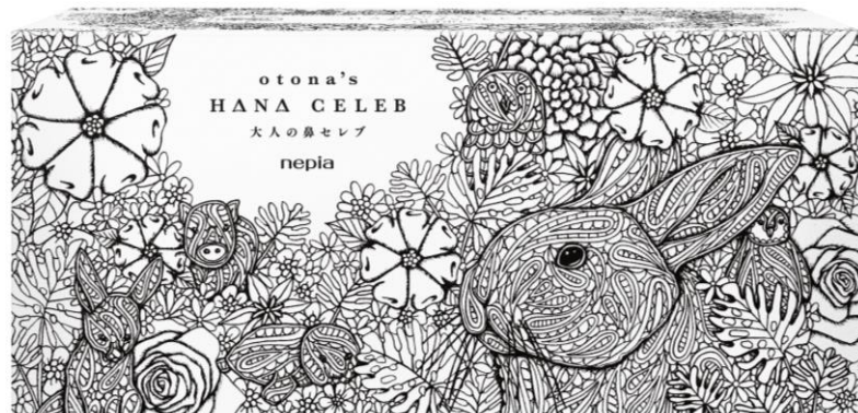
「nepia 大人の鼻セレブ」新パッケージ

新パッケージは使用シーンを考え、お部屋のインテリアにマッチすることをコンセプトとしております。白を基調とし、緻密なエンボス加工を施した上質なパッケージはインテリアを邪魔しにくいシンプルで高級感溢れるデザインとなっております。今回起用したデザイナーはイギリス人作家ジョージ・ウールリッジ氏。彼女の得意とする自然と動物の描写を軸に書き下ろした一点もののデザインは、女性を中心に人気が高まる「大人の塗り絵」がテーマとなっており、その繊細なタッチはインテリアとしてもお部屋に彩りを与えます。