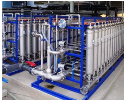
当社限外ろ過装置 OJI-MEMBRANE™ ユニット

従来はそれぞれのプロセスに大規模な装置を設置しておりましたが、独自の薬品処方と当社製品のOJI-MEMBRANE™を組み合わせることで、従来よりもコンパクトかつ低コストで品質の高い工業用水を製造することが可能になりました。