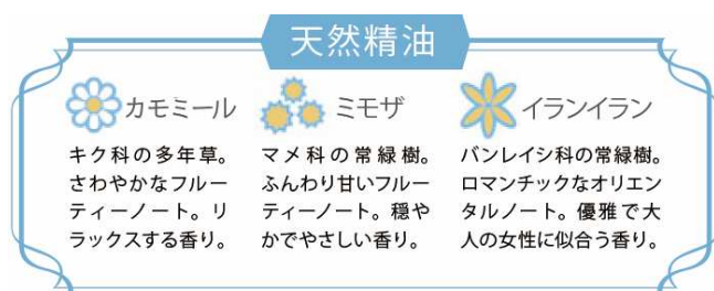
「フラワーシンフォニーの香り」 30～40代女性 モニター調査