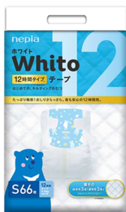
パッケージデザイン