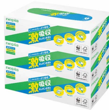
ネピア 激吸収キッチンタオル ボックスタイプ