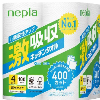
ネピア 激吸収キッチンタオル 400 カット