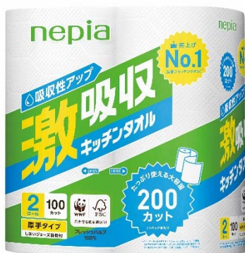
ネピア 激吸収キッチンタオル 200 カット

また、取り出しやすくさっと使えるボックスタイプを同ブランドで新たにラインアップに加え、お客様の幅広いニーズにお応えいたします。