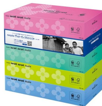
プロジェクト告知商品イメージ

「ネピア 千のトイレプロジェクト／第 12 フェーズ」では、2019年11月1日(金)から2020年1月31日(金)までの3ヶ月間、プロジェクト告知商品を日本全国で数量限定販売いたします。告知商品のパッケージには写真家・小林紀晴氏の写真を起用し、販売店様のご協力のもと、店頭を通じた告知活動を行い、世界の「水と衛生の問題」への関心を高め、理解を深めることに努めてまいります。キャンペーン期間中の対象商品の売上の一部で、ユニセフの「水と衛生に関する支援活動」をサポートし、アジアで一番若い独立国である東ティモールを支援対象国として、屋外排泄の根絶を目指します。