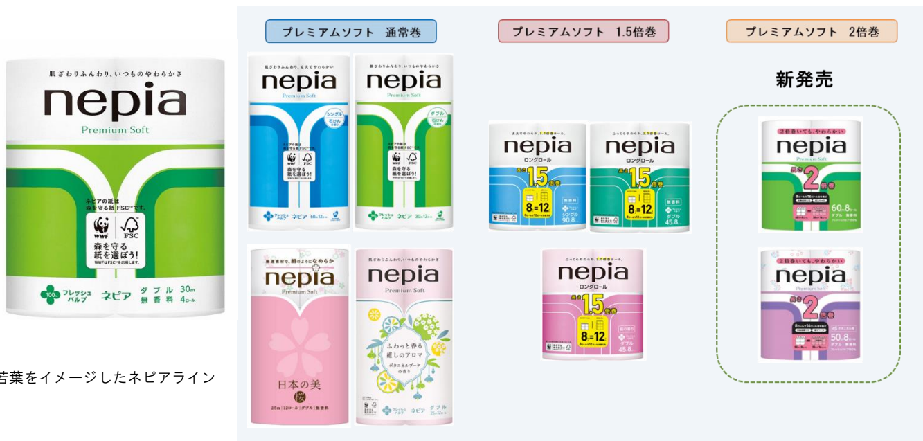
若葉をイメージしたネピアライン

「ネピア プレミアムソフト トイレットロール」のパッケージには、若葉が勢いよく芽吹く様子をイメージした“ネピアライン”をデザインしています。この“ネピアライン”はこだわった品質であることの証です。ぜひ、店頭ではネピアラインを目印に商品をお探しください。