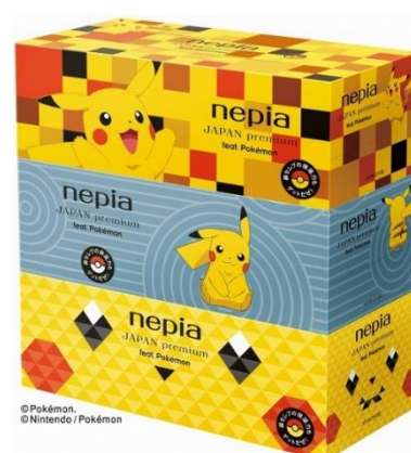
ボックスティッシュ3コパック No.2 (市松模様、枯山水、折り紙 各1コ)