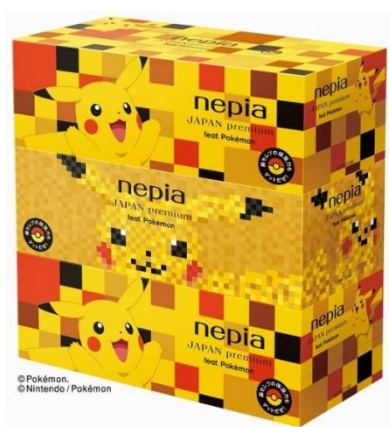
ボックスティッシュ3コパック (市松模様2コ、寄木細工1コ)