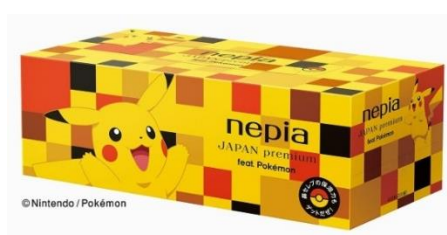
ボックスティッシュ1コ (市松模様)