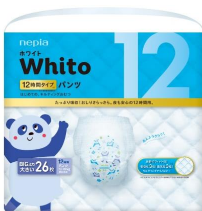
<パンツ BIG より大きいサイズ 12 時間タイプ>

王子ネピア株式会社(本社：東京都中央区、代表取締役社長：用名 浩之)は、赤ちゃん用紙おむつ『ネピア White(ホワイト)』の新商品「パンツ BIG より大きいサイズ 12 時間タイプ」を、2020年6月より日本国内および中国にて発売開始いたします。