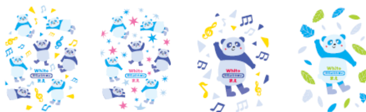
<おむつデザイン：全8種>