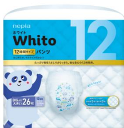
<パッケージデザイン>

パンツ BIG より大きいサイズには、パンダを動物アイコンとして採用しました。また、おむつ柄は、月齢の高いお子さまにも親しまれるデザインに仕上げました。