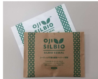
SILBIO EZ SEAL