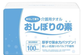
介護用タオル おしぼりの素