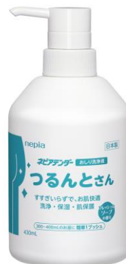
ネピアテンダー おしり洗浄液 つるんとさん