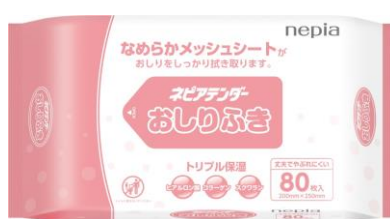
ネピアテンダー おしりふき