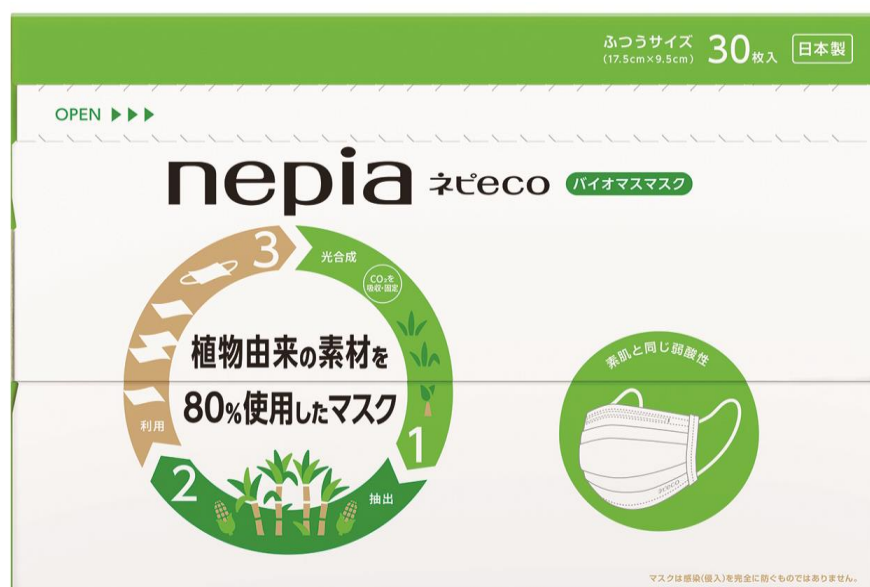
ネピア ネピ eco バイオマスマスク 30枚入(10枚×3パック)

配送方法：ご自宅のポストに投函いたします。ポスト投函タイプだから、受取もらくらく。