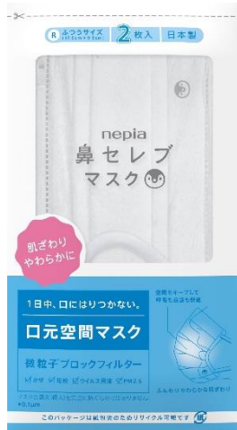
「ネピア 鼻セレブ口元空間マスク 紙エールパッケージ」

王子ネピア株式会社（本社：東京都中央区、代表取締役社長：用名浩之）は、兼ねてより販売中の「ネピア 鼻セレブマスク」シリーズに、リサイクル可能で環境に配慮した紙製パッケージ品「ネピア 鼻セレブマスク 紙エールパッケージ」を追加ラインナップいたします。まずは法人向けのノベルティ商品として、5月下旬より取り扱い開始予定です。