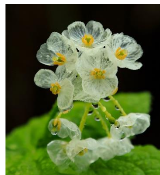
梅池自然園のサンカヨウ

「サンカヨウ」は、使用パルプの最適化と抄紙技術の検討で特定樹脂の浸透性を高め、より効率よく透明化させることが可能です。また、リサイクル時の離解性を向上させ、透明化してもリサイクルが可能な新規包装用紙です。