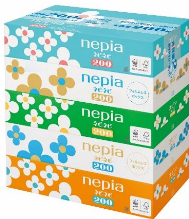
ネピア ネピネピ ティッシュ 5 コパック 400 枚 (200 組)

王子ネピア株式会社（本社：東京都中央区、代表取締役社長：用名浩之）は、ボックスの取り出し口部分のフィルムをなくし、押すだけで簡単にティッシュが取り出せるフィルムレスボックス「ネピア ネピネピ ティッシュ 5 コパック 400 枚 (200 組)」を、2023年3月1日（水）より全国のスーパー、ドラッグストアにてリニューアル発売いたします。