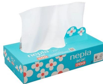
ネピア ネピネピ ティッシュ 5 コパック 400 枚 (200 組)

ボックスティッシュは、通常、スムーズに取り出せるように取り出し口部分にフィルムを使用していましたが、お客様から「フィルムを使用せずにそのまま廃棄できるようにしてほしい」、「無駄な素材を使わない商品を考えてほしい」といったお声をいただいております。