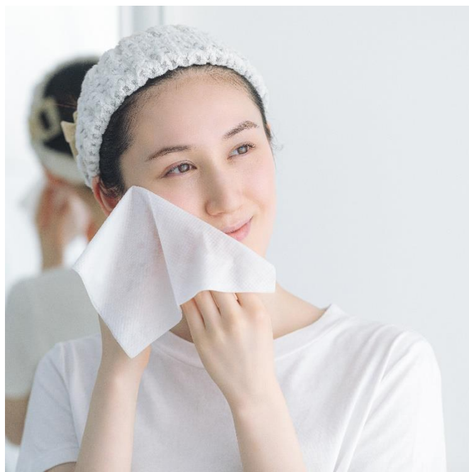
「ネピア 鼻セレブ洗顔専用」