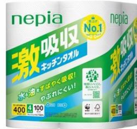
リニューアルデザイン

※1：「ペーパータオルカテゴリー70カット以上のロールタイプ」市場、ネピア激吸収キッチンタオルブランド、累計販売金額/容量シェア（2021年4月～2023年3月）、全国、全業態、インテージ SRI+調べ