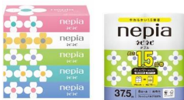
現行品（ネピネピシリーズ）