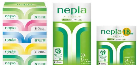
リニューアルデザイン（プレミアムソフトシリーズ）