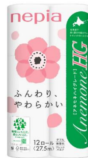
リニューアルデザイン