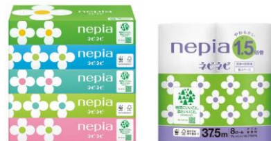
リニューアルデザイン（ネピネピシリーズ）