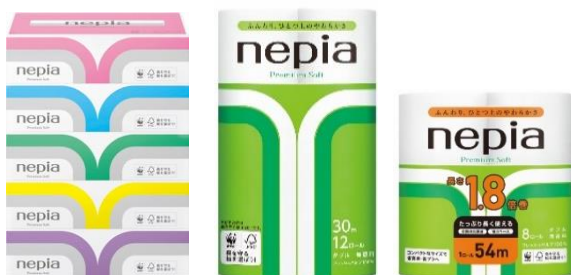
現行品（プレミアムソフトシリーズ）

若葉をイメージして創られたネピアラインに大胆にグラデーションを使い、上質なイメージやみずみずしい透明感を表現したパッケージデザインに変更。かわいいお花のデザインとカラフルさが特長のネピネピは、メリハリのある濃い色味に変更しました。さらに、商品名「プレミアムソフト」を英語表記からカタカナ表記へと変更し、可読性を高めました。