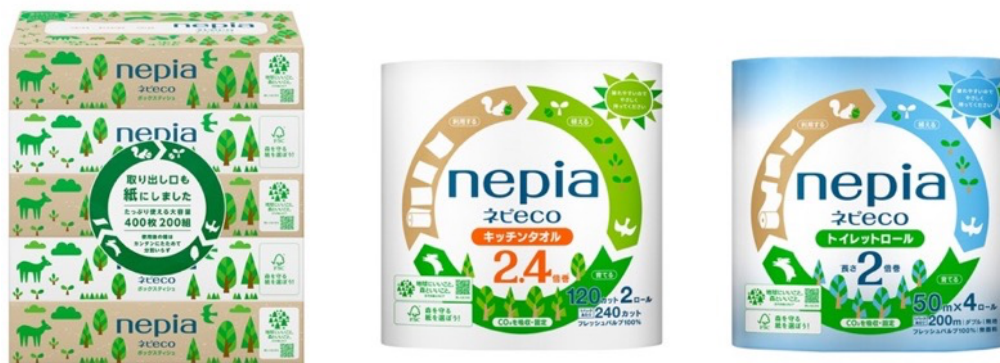
「森と地球の未来 nepia 環境月間キャンペーン」対象商品

店頭での特設売り場展開と合計 300 名に当選する大型キャンペーン実施による相乗効果で、当社の環境への取り組みを多くのお客様にお伝えすることを目指します。